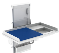
Table à langer électrique 334-141-011 - largeur 140 cm + lavabo et robinet

Table à langer électrique à hauteur variable pour bébé 334-141 - largeur 140 cm + lavabo