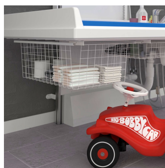
Il y a un dispositif de sécurité sous toute la zone d'allaitement qui arrête le mouvement de la table lorsqu'il rencontre la moindre résistance.