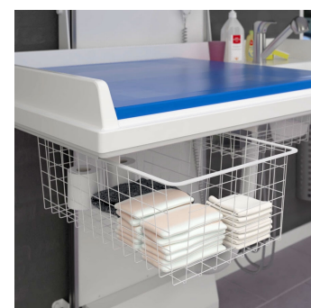
Les tiroirs sont standard sur une table de 140 cm de large.