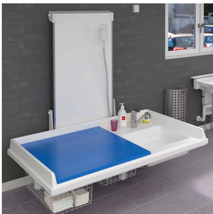
La table à langer peut être abaissée jusqu'au sol pour permettre aux enfants de s'asseoir sur la table.