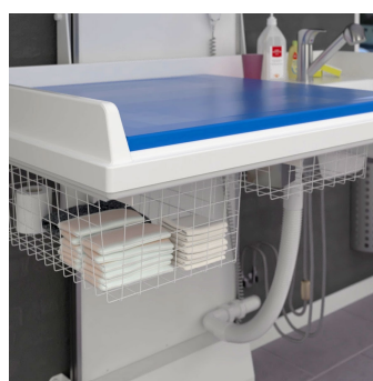
La surface de la table de soins est en plastique moulé.