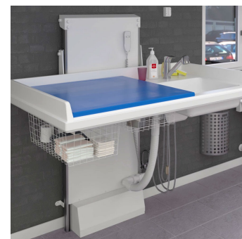
334 - Table à langer avec réglage motorisé de la hauteur incl. matelas et lavabo à droite, largeur 140,0 cm.