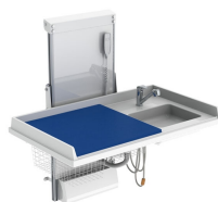
Table à langer électrique 334-141-111 - largeur 140 cm + lavabo et robinet

Table à langer électrique 334-141-011 - largeur 140 cm + lavabo et robinet