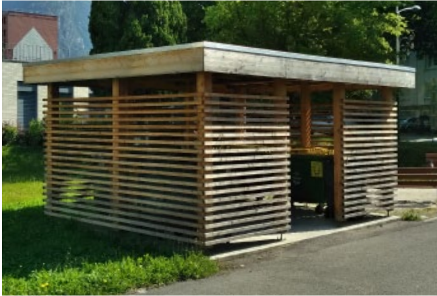
Essence de bois douglas naturel, sur demande spéciale