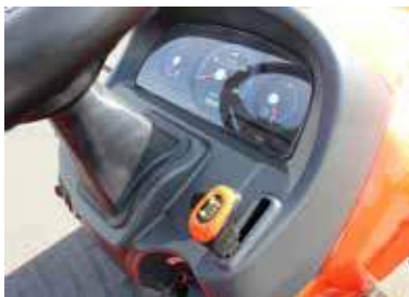
Tableau de bord simple et intuitif

La grande plateforme de conduite du CS2220 totalement dégagée bénéficie d'un tapis de sol en caoutchouc résistant, amortissant les vibrations et antidérapant pour toujours plus de sécurité.