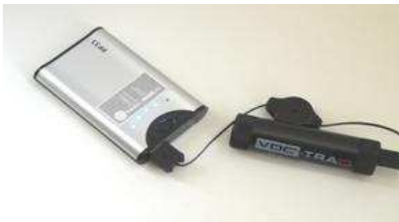
VOC-TRAQ et sa batterie Li/ion 50 h