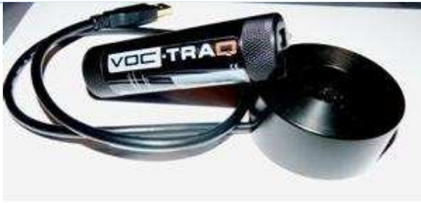
VOC-TRAQ et son socle de chargement PC