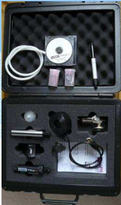
VOC-TRAQ et sa mallette accessoires