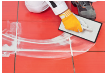
Mortier de jointoiment