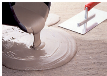
Masse de nivellement liquide