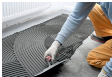
Colle à carrelage