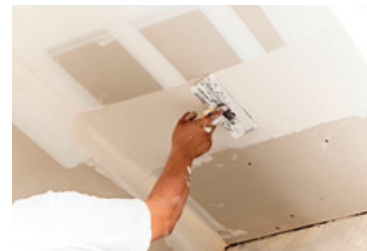
Enduit de lissage