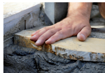
Mortier à base de pierre naturelle