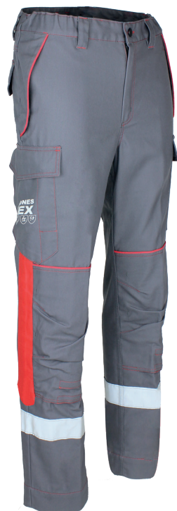
Gris Acier/Rouge 20R