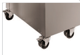
Stand à roulettes