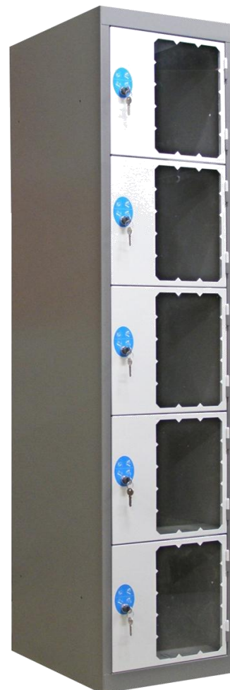
Meuble 1 colonne de 5 cases | 400 : MM541ECT

Tablettes intermédiaires en tôle galvanisée à chaud, non peintes.