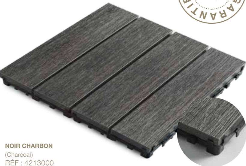
NOIR CHARBON (Charcoal) RÉF : 4213000