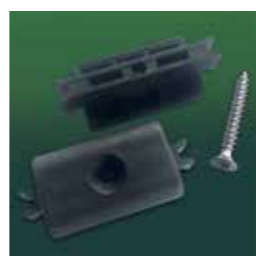
CLIP DE JONCTION