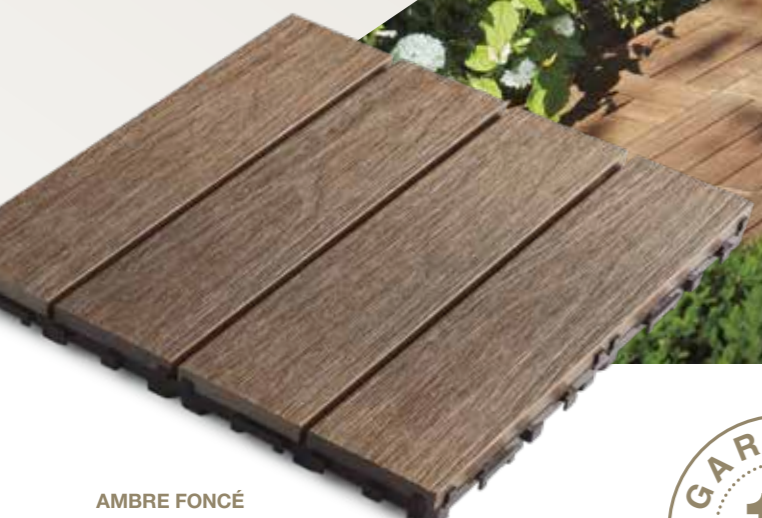
AMBRE FONCÉ (Amber) RÉF : 4213001