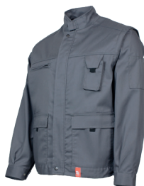
Gris Acier 20