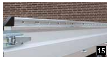
Logement de rampes au-dessous de remorque incl. support de plancher (standard à modèles)