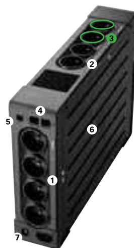
Eaton Ellipse PRO 1200/1600