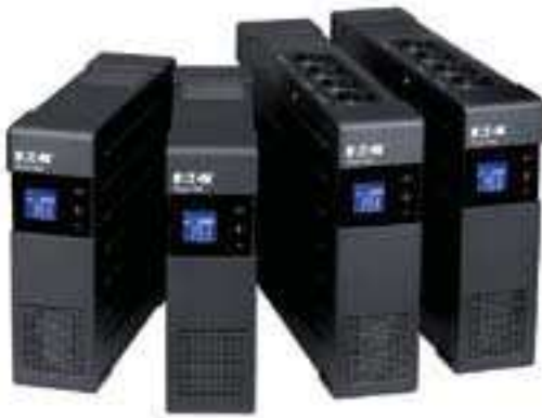
Gamme Ellipse PRO