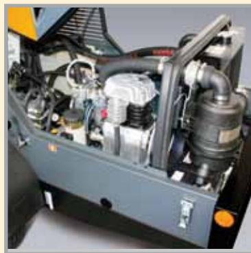
Grâce au régime moteur max. de seulement 2 600 tr/min. et à l'excellente insonorisation, la SP 11 est une machine très silencieuse.