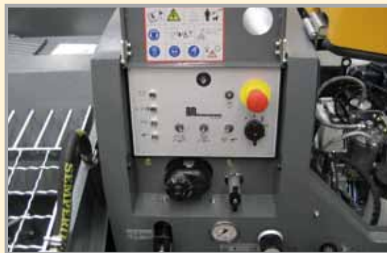
Le tableau de commande permet de piloter l'ensemble de la SP 11. La machine est conforme à la directive CE.