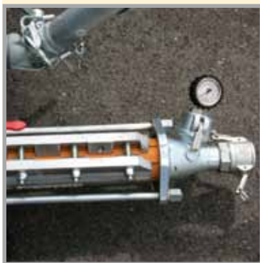
La pompe à vis 2L6 puissante avec embout de sortie pour le raccordement du flexible.

** Les rendements indiqués sont des valeurs empiriques et dépendent du matériau mis en œuvre.