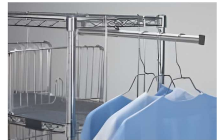
Penderie extérieure Longueur totale : 510 mm Longueur utile 340 mm