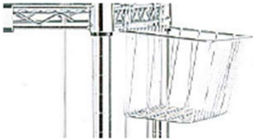
Panier Dimensions : L.340 x P.130 x H.150 mm