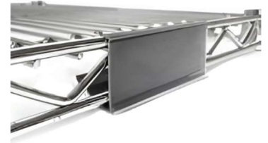
Porte étiquettes Avec protection PVC transparent