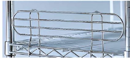
Côté étagère Largeur 457 mm