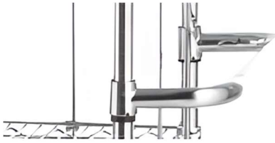
Poignée de manutention Largeur 457 mm