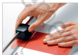
Rapporteur pour une coupe précise des angles