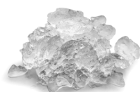
MF 66 Glace en Supergrains Eau résiduelle 15%