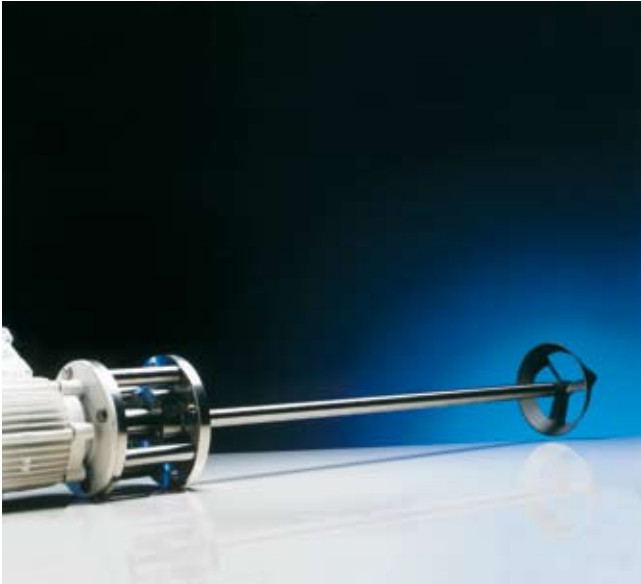
Agitateur haute vitesse

Les mélangeurs Verdermix peuvent être utilisés pour des applications spécifiques et générales dans un grand nombre d'industries dont l'agro-alimentaire et l'industrie pharmaceutique.