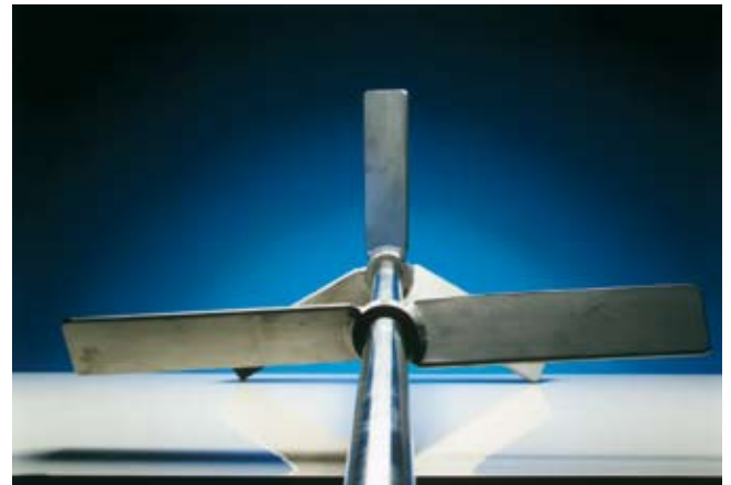
Agitateur vitesse lente

Le modèle VNF tourne à une vitesse de 750 à 1800 tr/min et son moteur électrique, construit selon la norme IEC doit être utilisé pour des efforts limités. Il peut être équipé d'étanchéité de tige, de lanternes et presse-étoupe ou de revêtement résistant aux agressions chimiques. Des pieds peuvent être ajoutés, fixes ou mobiles, selon vos besoins.