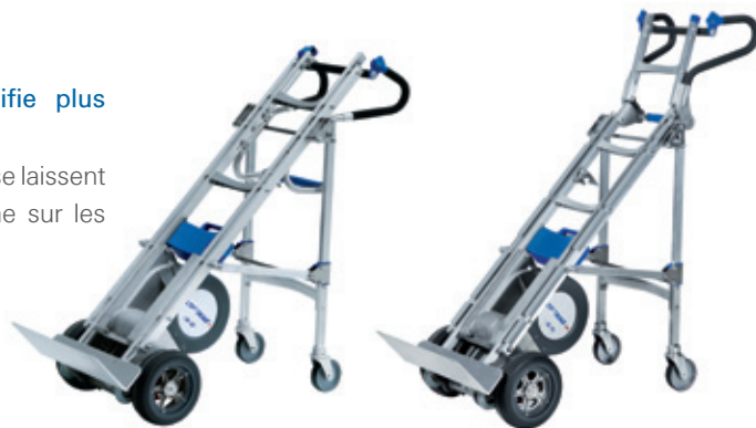
LIFTKAR HD Dolly

Dolly et Fold Dolly se laissent pousser sans peine sur les terrains plats.