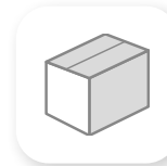
GESTION DU STOCK