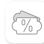
GESTION DES PROMOTIONS