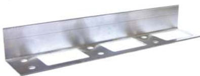
BrickBlock TM Profil pour pavage