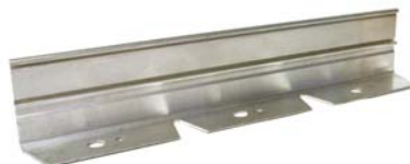
StructurEdge TM Profil lourd pour pavage et stabilisé