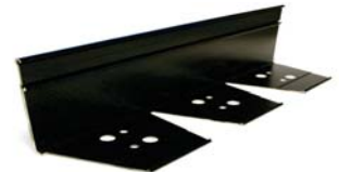
AsphaltEdge TM Profil pour asphalte

Solutions en aluminium pour toutes délimitations d'espaces en paysage, VRD, bâtiment.