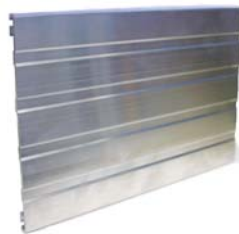
CleanLine XL TM Bordure paysagère lourde