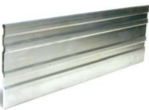
CleanLine TM Bordure paysagère standard