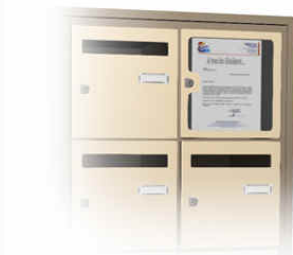
Tableau d'affichage intégré dans le bloc. (occupe 1 case du bloc)