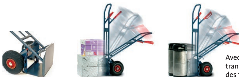
Avec pince-fût pour un transport confortable et sûr des fûts