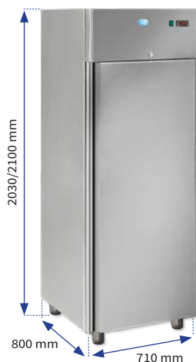
Armoire 700, en acier inox