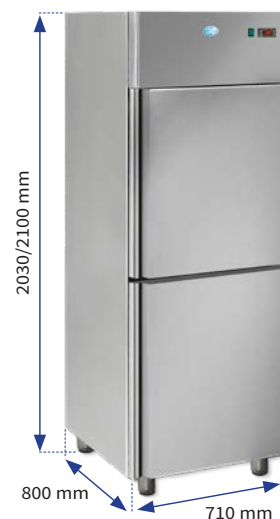
Armoire 700, en acier inox avec 2 portes