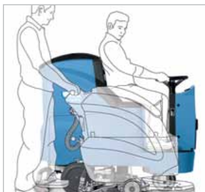
Une laveuse autoportée aux mêmes dimensions qu'une accompagnée.