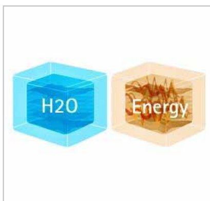
Jusqu'à 4 heures de travail continu sans interruption avec 1 recharge d'eau & 1 recharge électrique.