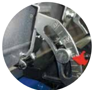
Guide inclinable à 45° Geleider verstelbaar tot 45°