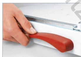
Levier EASY-LIFT pour retirer aisément le document coupé