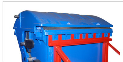
MH-II à 1100 l