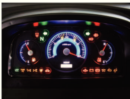
Tableau de bord électrique

La technologie digitale du tableau de bord confère une meilleure visibilité même en plein jour.