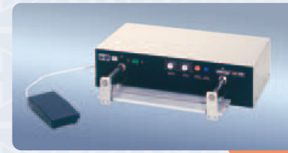
Polystar 401 HM

Tous les appareils sont livrés avec un câble d'alimentation de 3 m. Dimensions et poids approximatifs. Sous réserves de modifications techniques.