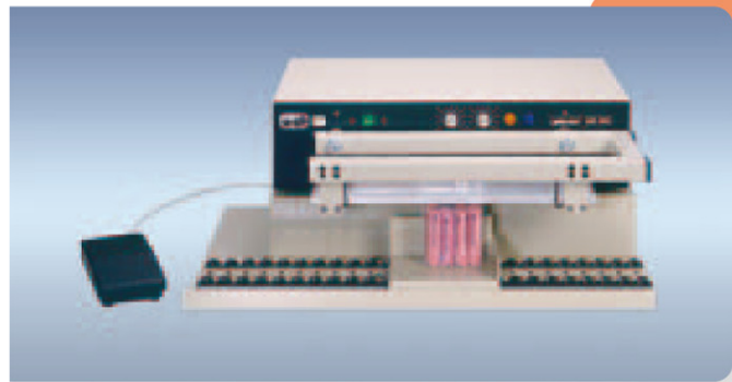
Polystar 401 HM-U