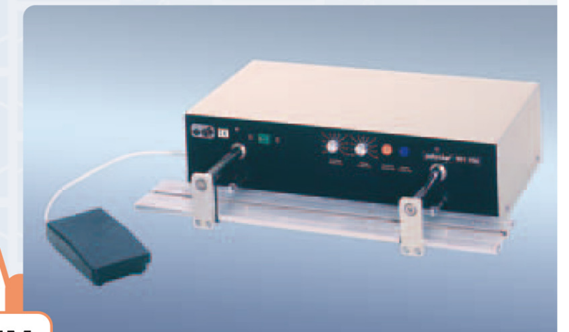
Polystar 601 HM