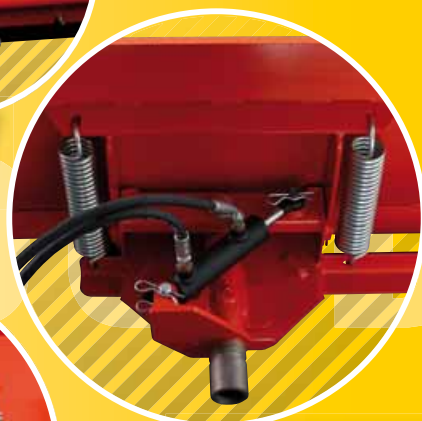
2 HYDR. WINKELVERSTELLUNG HYDR. ANGLE ADJUSTMENT REGLAGE HYDR. DE L'ANGLE D'ATTAQUE