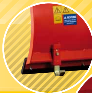
1 STAHLSCHEIFKUFEN STEEL SKID SHOES PATIN D'ACIER