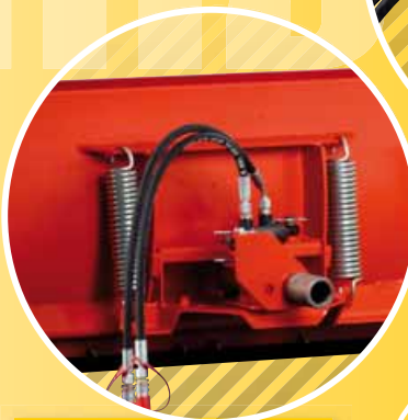
3 FEDER SPRINGS RESSORT