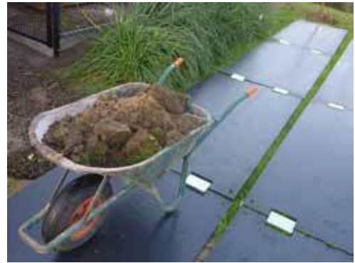
Chemin de circulation sur terre