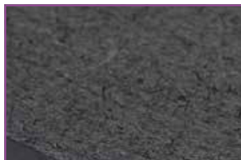
Finition anti-dérapant sur la surface totale