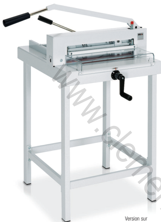
Version sur stand métallique

Massicot manuel de bureau adapté au format A3. Idéal pour le service reprographie des entreprises et administrations.