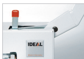
Dispositif de blocage de lame (levier en position haute)