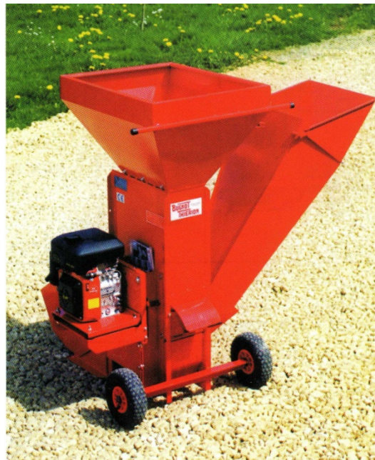
Broyeur BV.2, version thermique 5 CV essence

D'un disque plein support d'un ou deux couteaux latéraux