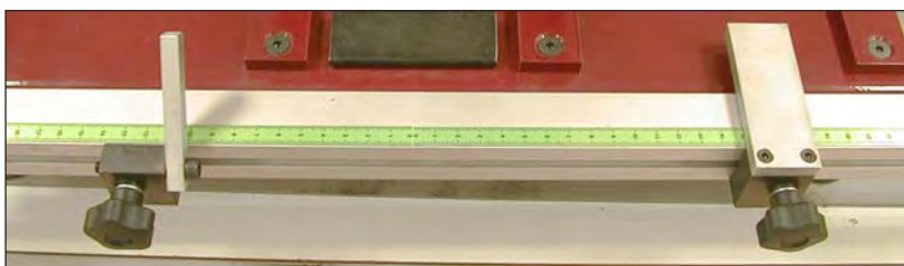
Réglages du centrage Longueur / Largeur