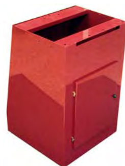
Z6554 - Bati