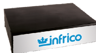
Tête décorative éclairée