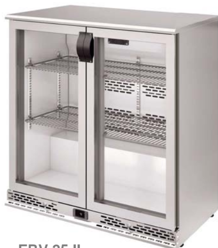
ERV 25 II