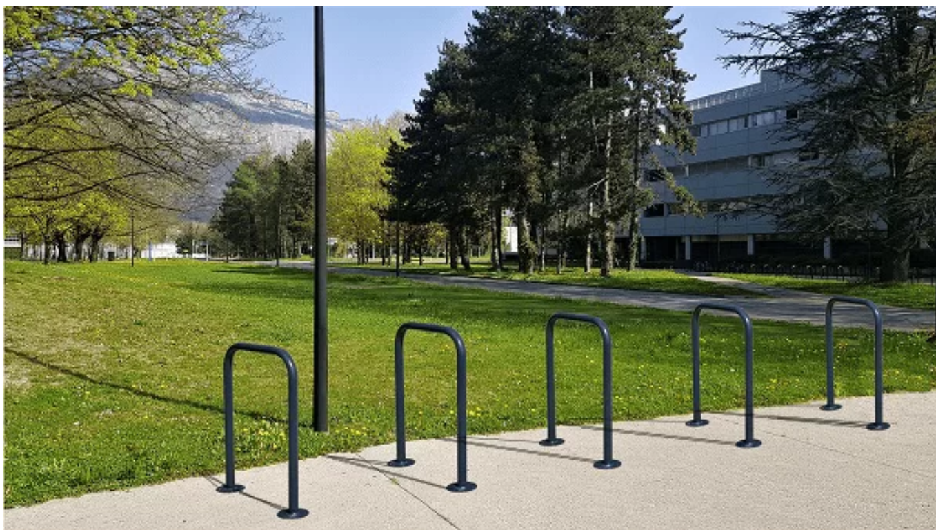
Figure 1: Arceau U inversé - vue générale