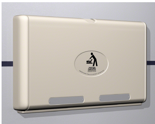
TABLE À LANGER MURALE : AX6901-I