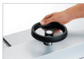
Dispositif de pression actionné par volant

Un massicot électrique d'excellent rapport prix/performances avec des équipements pratiques dont la nouvelle commande bi-manuelle EASY-CUT.