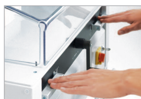
Commande bi-manuelle EASY-CUT