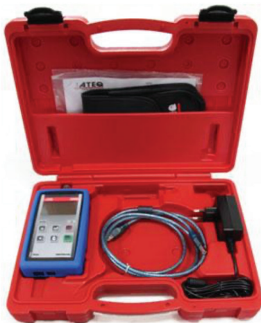
Calibreur de débit de fuite CDF60 (accessoire)