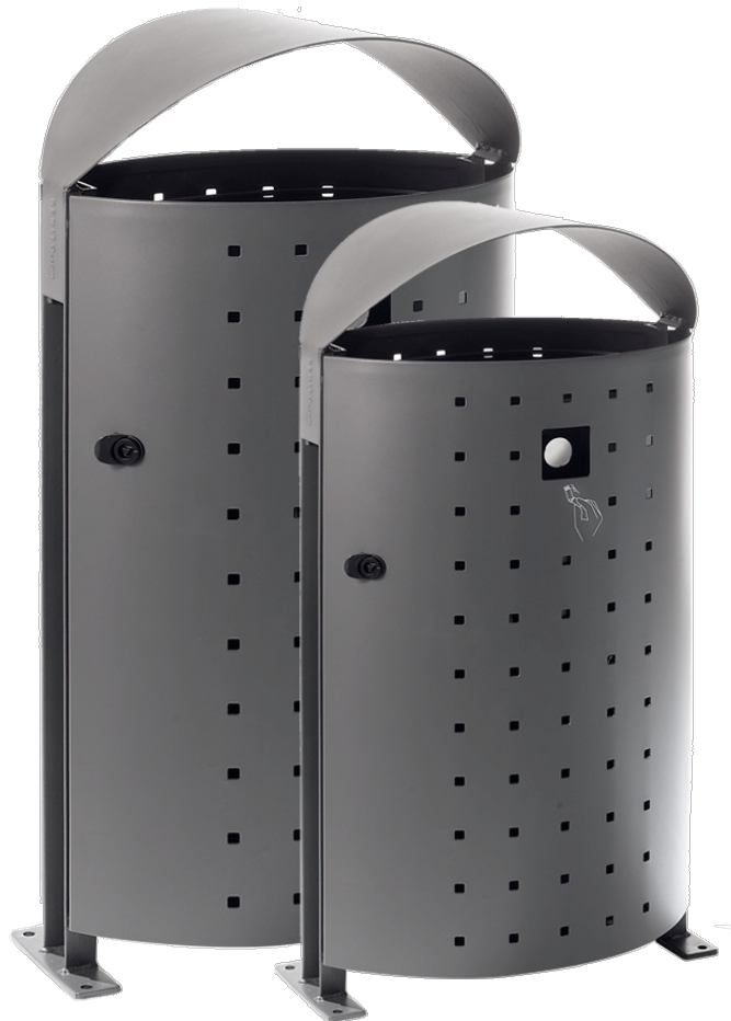
Dara Plus PA694GE