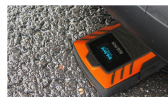
Résistant à l'écrasement