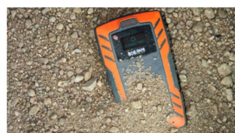
Étanche à la poussière