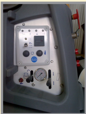
Le tableau de commande est simple, clair et complet