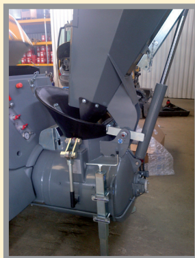
La cuve est équipée de béquilles stabilisatrices et d'un entonnoir en matière composite peu salissante.