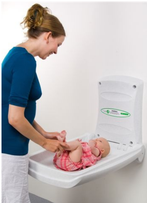
Table à langer murale verticale