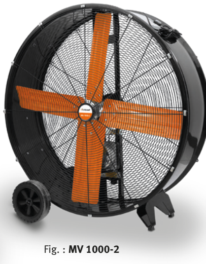
Fig. : MV 1000-2