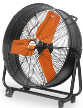
Fig. : MV 610-3