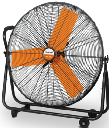
Fig. : MV 760-3