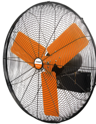
Fig. : WV 610-2