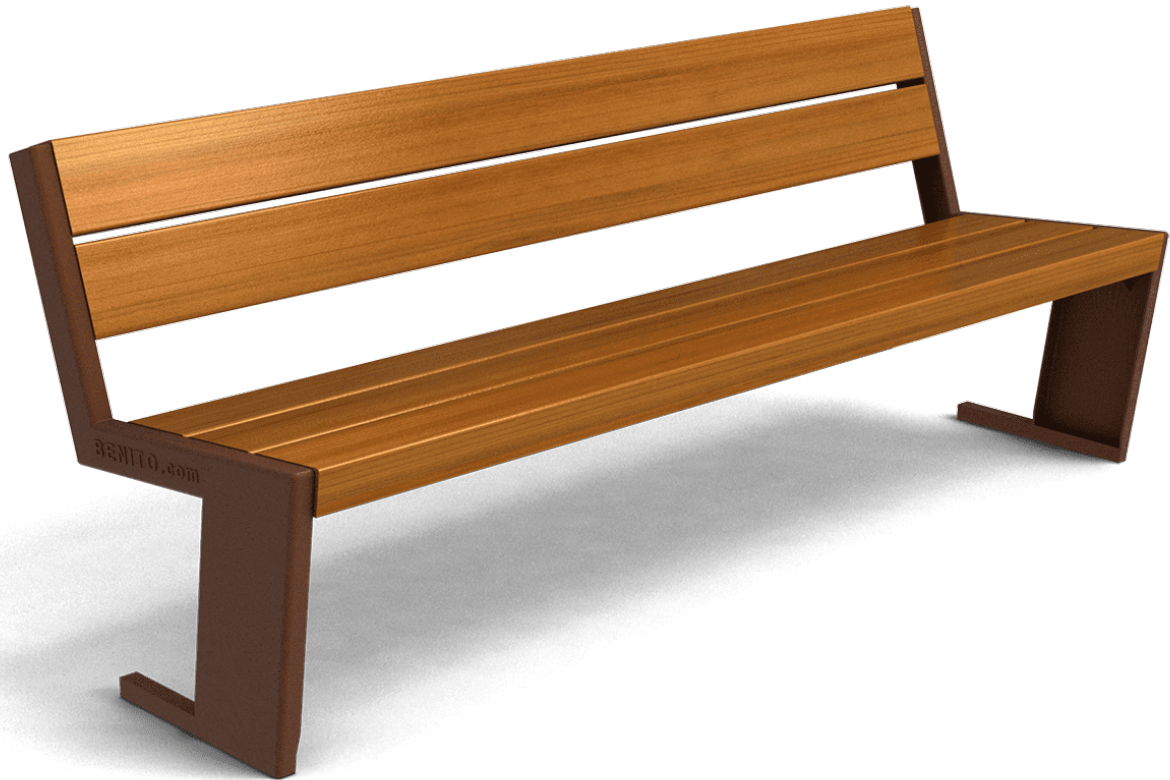
Quatro S UM377SM