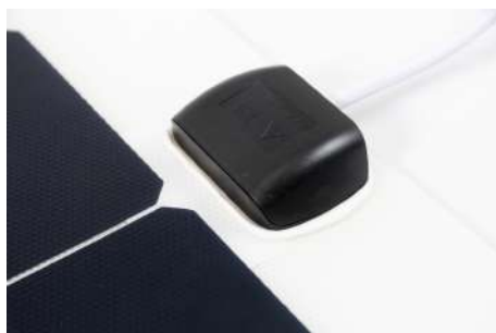
La boite de jonction des PERC-FLEX 115/145 et 210 est en mono câble 3 m