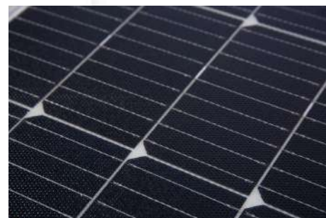
Le PERC-FLEX est composé de cellule PERC 9BB