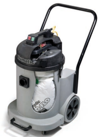
Système anti-colmatage AIRFLO