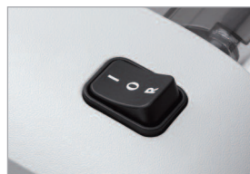
Interrupteur multi-fonctions marche / arrêt / retour