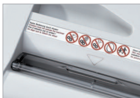
Volet de sécurité transparent au niveau de l'ouverture