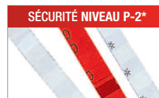
Modèle C/F - 4 mm Pour les documents internes.