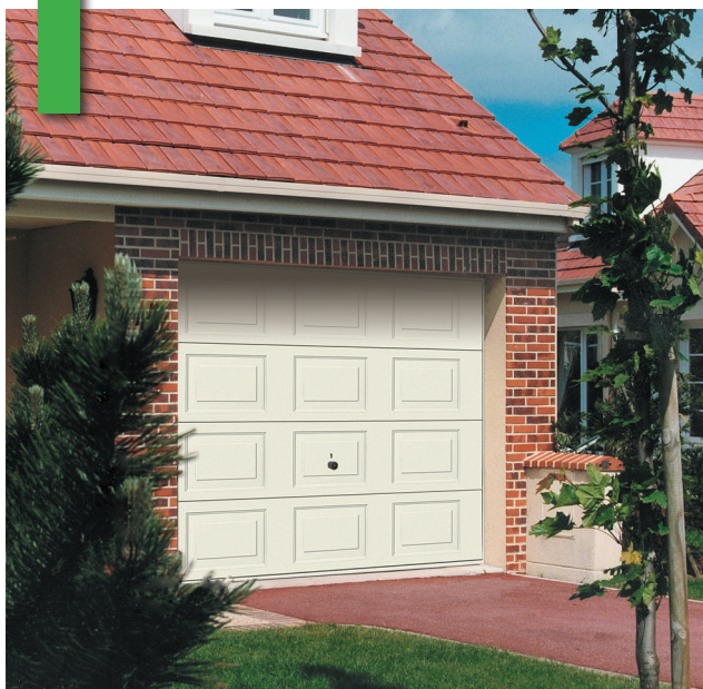
Porte basculante EuroPro motif 225, RAL 9016

Ecoîçon mini : 65 mm Retombée de linteau mini : 80 mm (pose sur sol fini) Conditionnement : palette de 12 portes