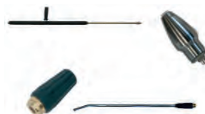
Kit lance turbo (équipement selon modèle)